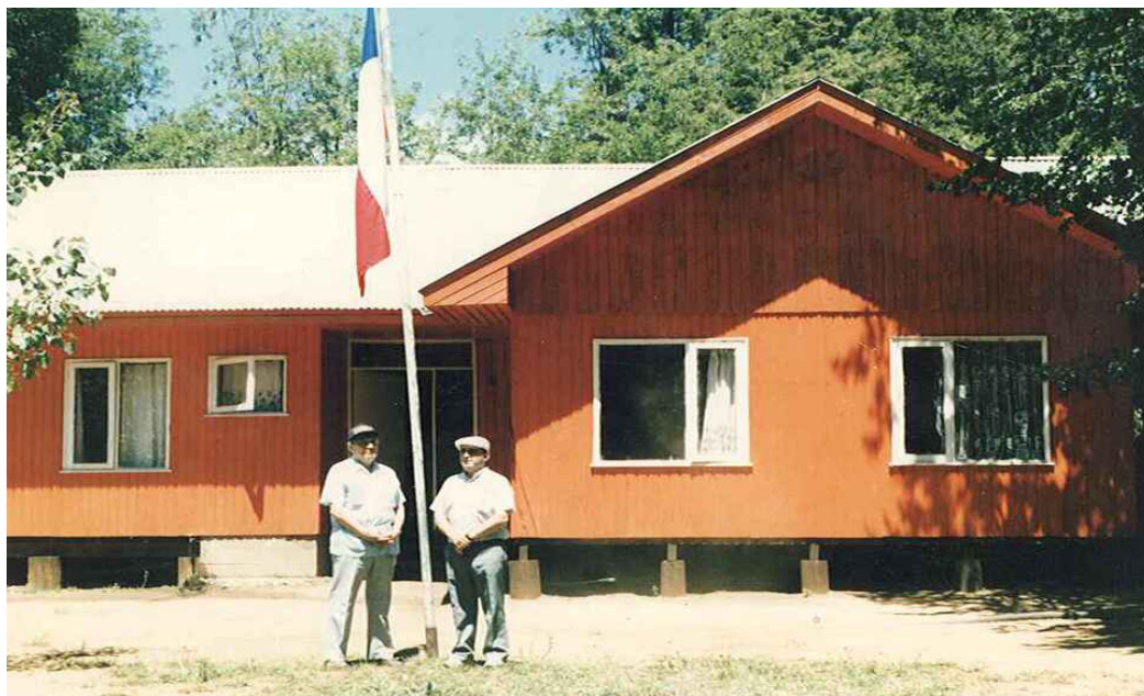
Refugio de vacaciones en Vilches.