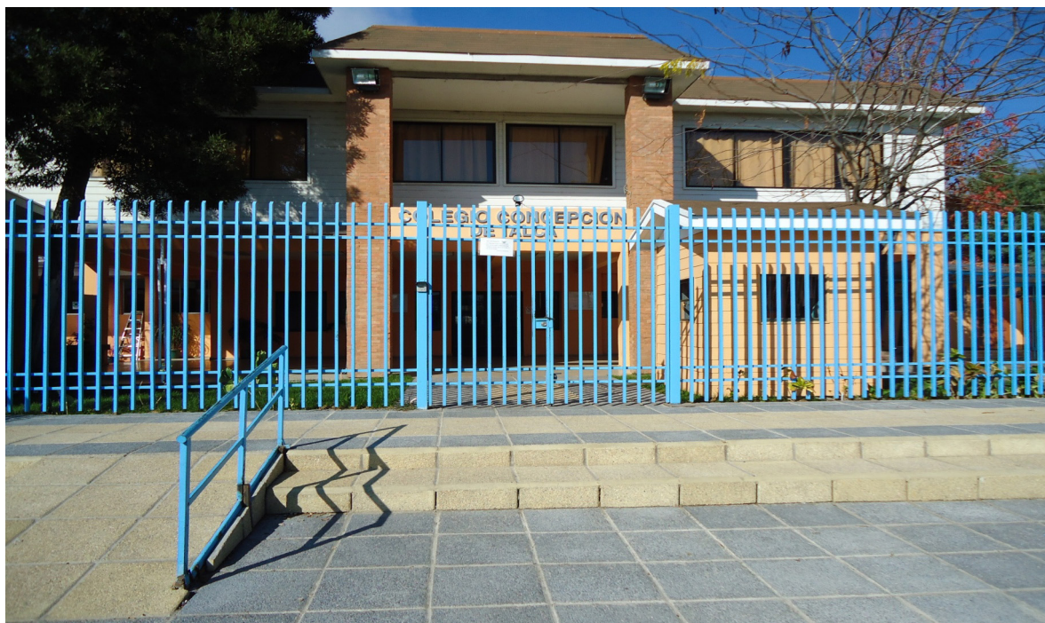
Colegio Concepción, Talca.